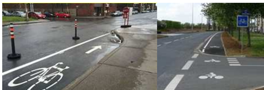
Illustration des deux principes d'aménagements envisageables : 1) renvoi des vélos sur la chaussée ou 2) remontée de la piste sur une partie du trottoir qui leur est dédié.